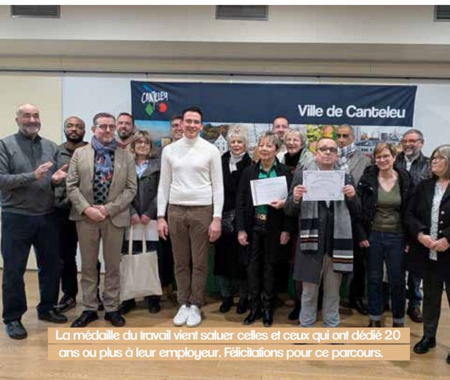
La médaille du travail vient saluer celles et ceux qui ont dédié 20 ans ou plus à leur employeur. Félicitations pour ce parcours.