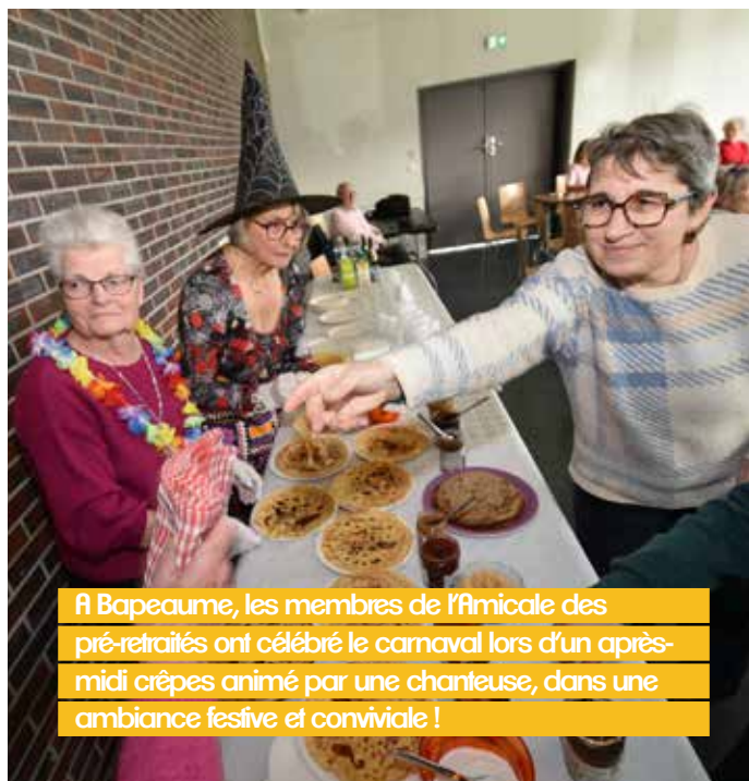
A Bapeaume, les membres de l'amicale des pré-retraités ont célébré le carnaval lors d'un après-midi crêpes animé par une chanteuse, dans une ambiance festive et conviviale !