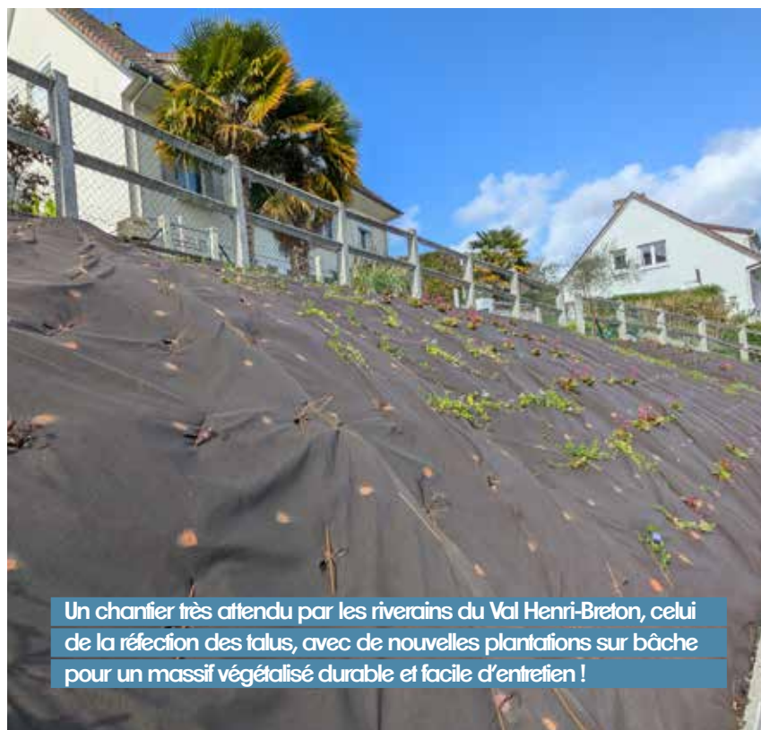
Un chantier très attendu par les riverains du Val Henri-Breton, celui de la réfection des talus, avec de nouvelles plantations sur bâche pour un massif végétalisé durable et facile d'entretien !