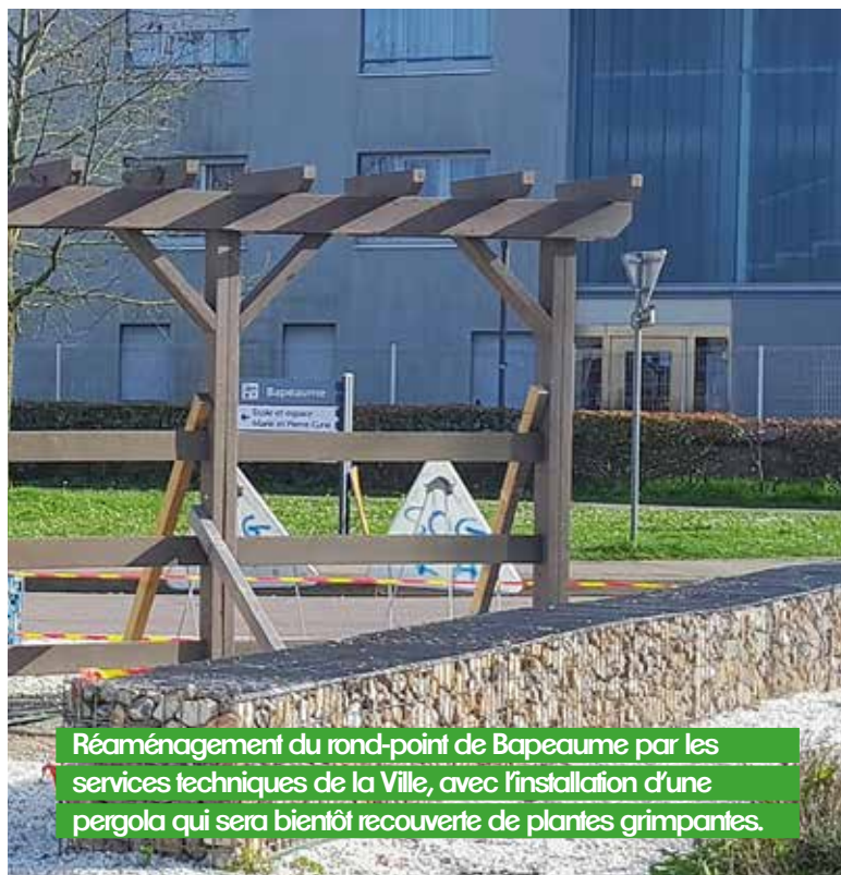
Réaménagement du rond-point de Bapeume par les services techniques de la Ville, avec l'installation d'une pergola qui sera bientôt recouverte de plantes grimpantes.