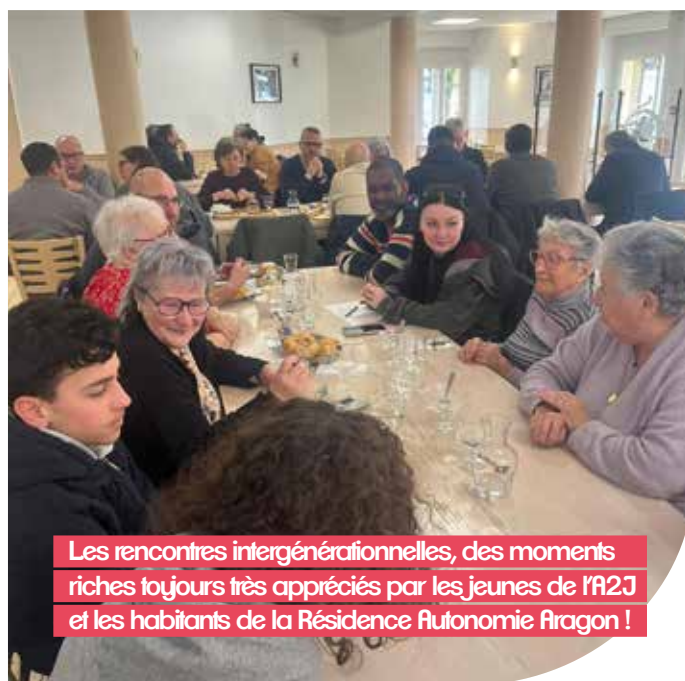
Les rencontres intergénérationnelles, des moments riches toujours très appréciés par les jeunes de l'A2J et les habitants de la Résidence Autonomie Aragon !