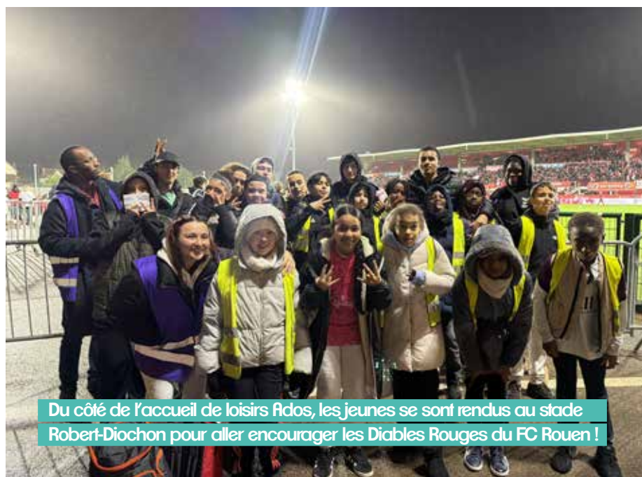
Du côté de l'accueil de loisirs Ados, les jeunes se sont rendus au stade Robert-Diochon pour aller encourager les Diables Rouges du FC Rouen !