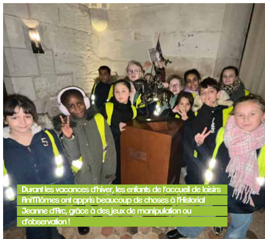
Durant les vacances d'hiver, les enfants de l'accueil de loisirs Ani'Mômes ont appris beaucoup de choses à l'Historial Jeanne d'Arc, grâce à des jeux de manipulation ou d'observation !