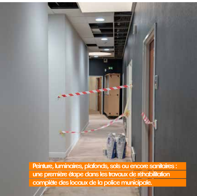
Peinture, luminaires, plafonds, sols ou encore sanitaires : une première étape dans les travaux de réhabilitation complète des locaux de la police municipale.