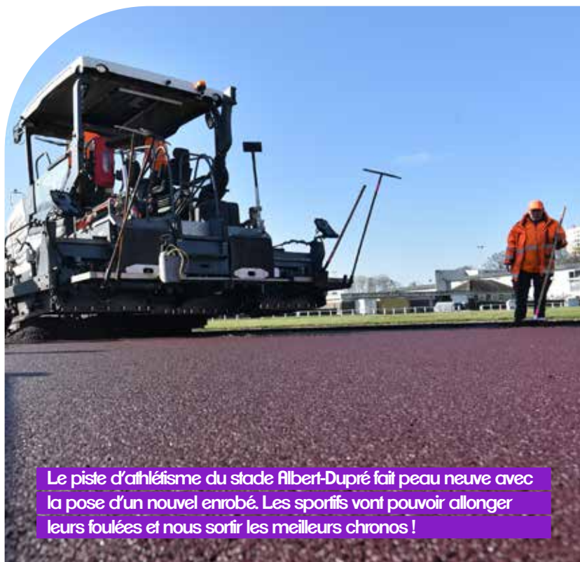
Le piste d'athlétisme du stade Albert-Dupré fait peau neuve avec la pose d'un nouvel enrobé. Les sportifs vont pouvoir allonger leurs foulées et nous sortir les meilleurs chronos !